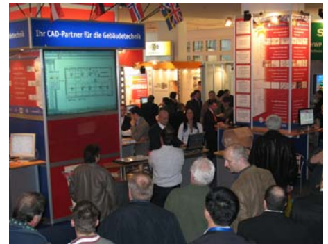
DDS oppnådde rekordomsetning på ISH-2007

På ISH messen kunne man være vitne til flere verdenspremierer hos DDS. Den nye versjonen DDS-CAD 6.4 ble presentert live. DDS begeistret de interesserte med et nytt produkt. DDS-CAD Building kunne kjøpes til en messepris på 980 € - DDS er sikret et gjennombrudd innen lavprissegmentet med dette geniale produktet. På grunn av den store etterspørselen ble messetilbudet forlenget til 31.04.07.